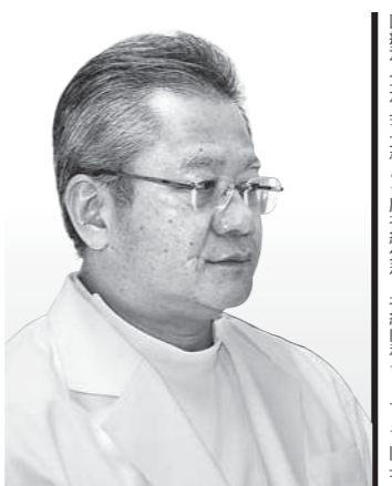
(いずみ・こうたろう) 1989年福岡大学医学部卒、鹿児島大学附属病院第3内科、鹿児島市立病院などを経て、11年6月に開院。日本神経学会神経内科学専門医・指導医、日本内科学会認定医。